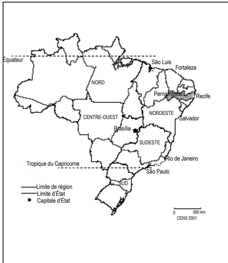
Carte - Hervé Théry (ENS)